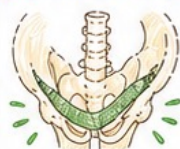
LSC(腹腔鏡下仙骨腔固定術)

仙骨にメッシュを固定するため、 解剖学的に強固な支持が得られ、 再発リスクの低減が期待できます。